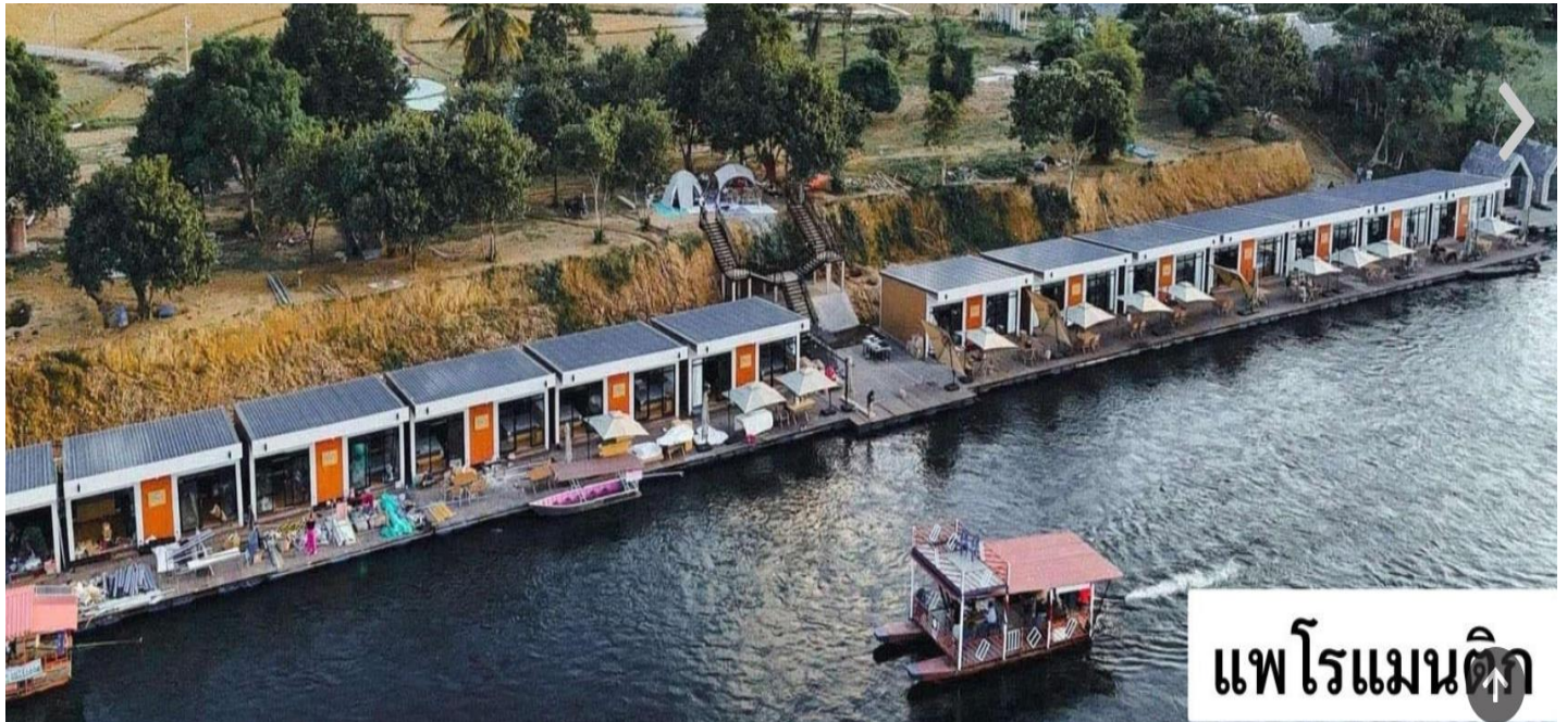
แพโรแมนติก