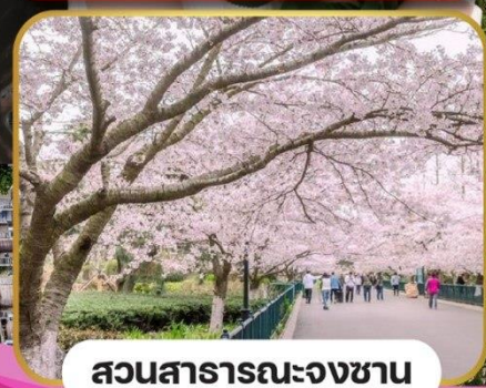
สวนสาธารณะจงซาน