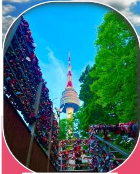
N Seoul Tower