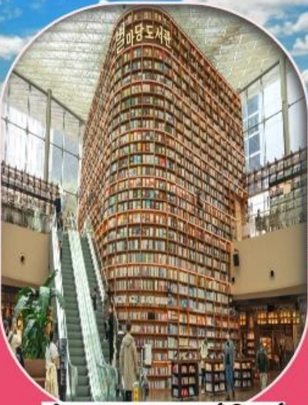
ห้องสมุดสตาร์ฟิลด์