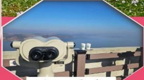
ส่องเกาหลีเหนือ