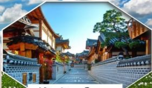
หมู่บ้านฮงกอินพยอง