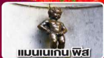
แมนเนเกน ฟิส