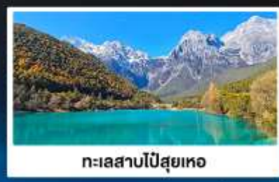
ทะเลสาบโป๋ส่วยเหอ