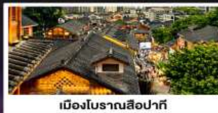
เมืองโบราณสี่牌坊