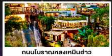
ถนนโบราณหลงเหมินฮ่าว