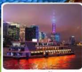
ส่องเรือแม่น้ำหวงผู่