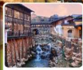
เมืองโบราณเหย้าหู