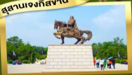
เป็นทรายเสียงชาวน