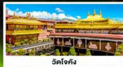
วัดโจกัง