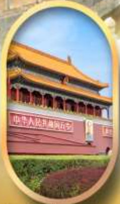
จัสมุติสเทียนอันเหมิน