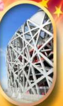
ผ่านชมสนามกีฬาโอลิมปิก