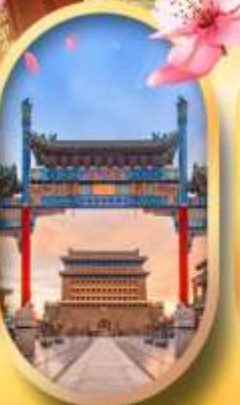
ถนนคนเดินเจียมเหมิน