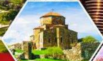
วิหารจวารี