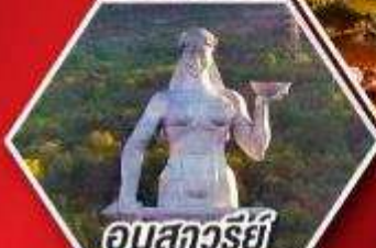
อนสาวรีย์ มารดาแห่งจอร์เจีย