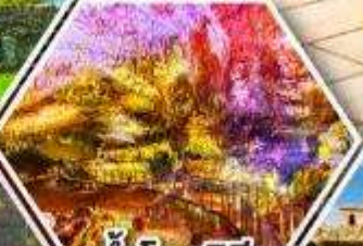
ถ้ำไฟรมีริอุส