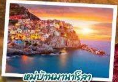
หมู่บ้านมหานรกโลก