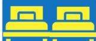
ห้องพักเตียงคู่ TWIN