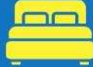
ห้องพักดับเบิล DOUBLE