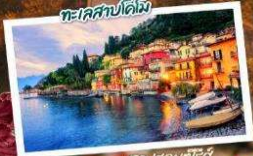
ตามรอยซีรีส์