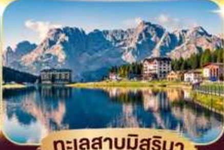
ทะเลสาบมิสุรีนา