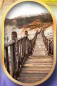
หุบเขาจิกุกดาบิ