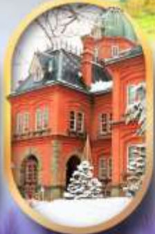
ศาลาว่าการฮอกไกโด