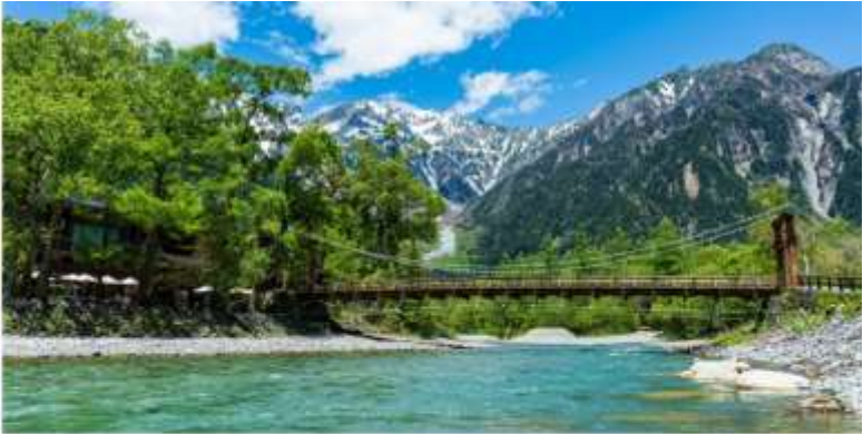
KAMIKOCHI KAPPA BASHI