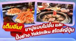
เต็มอิ่ม ขาปูแบบไม้อื่น และ ปิ้งย่าง Yakiniku สดร้อนญี่ปุ่น

Highlight สัมผัสความเป็นญี่ปุ่น ชมวิวฟูจิที่ ทะเลสาบยามานาทะเลสาบ ศาลเจ้าฟูจิซังเซนเนง "Unseen" ขอบพระด้วยหัวไชเท้า ที่วัดมัตสึจิยามา โชเดิน ถ่ายภาพวิวไร่ชาที่ โอบุจิ ชะชะบะ ขอบพระ วัดอาซากุสะ วัดพระโพลูซึกุ ไดบุทสึ เดินเล่น คาวาโกะเอะ Toyosu Senkyaku Banrai ซอปปิงย่านชินจูกุ และห้างไดเวอร์ซิตี