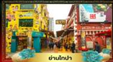
ย่านโกปา