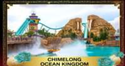
CHIMELONG OCEAN KINGDOM