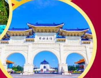
อนุสรณ์เจียงไคเช็ค