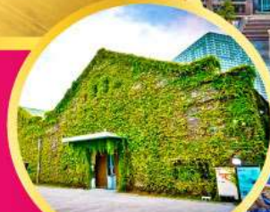
Huashan 1914 Creative Park