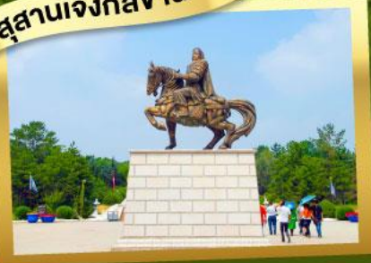
เนินทรายเสียงชาวน