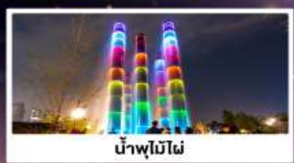
น้ำพุไม่ไผ่