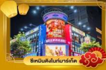
ช้อปปิ้งไนท์มาร์เก็ต