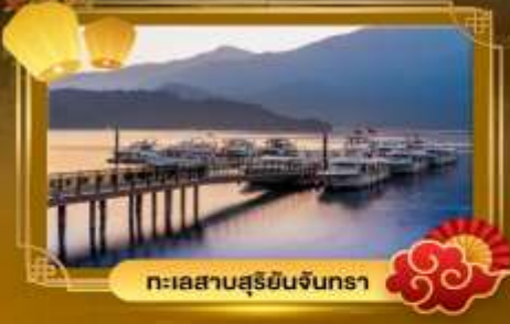
ทะเลสาบสุริยอินจันตรา