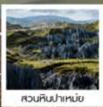
สวนหินป่าเหมย