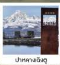
ป่ากลางเจียงตู