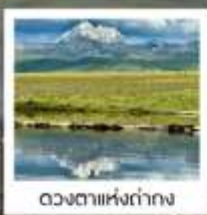
ดวงดาวหิ่งถ้ำก่าง