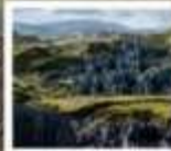
สวนหินปาเหมย์