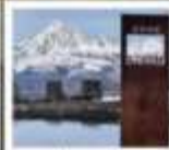
ป่าทางเฉิงตู