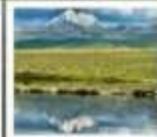
ดวงตาแห่งต้ากิง