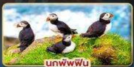
นกพิงฟิน

📅 เดินทาง : 30 เม.ย. - 07 พ.ค. | 23-30 ก.ค. 69