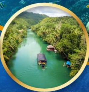
ล่องเรือแม่น้ำโลบ็อก