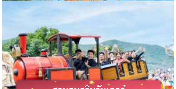
สวนสนุกวินวันเดอร์