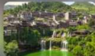
หมู่บ้านโบราณฟุทรงเจิน