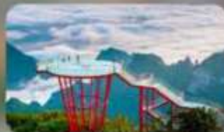
กุเจา 7 ดาว