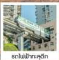
รถไฟฟ้ากะคุติ๊ก