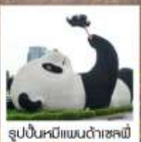
รูปปั้นหมีแพนด้าเซอซี