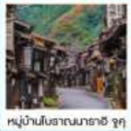
หมู่บ้านโบราณมาราชิ จุกุ