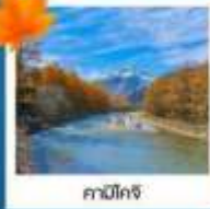
คามิโกจิ