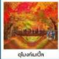
อุโมงค์เมเน็ค