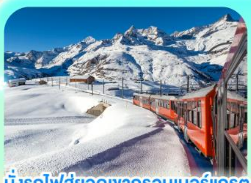
นั่งรถไฟสุดอลังการรอบนอร์แอนด์