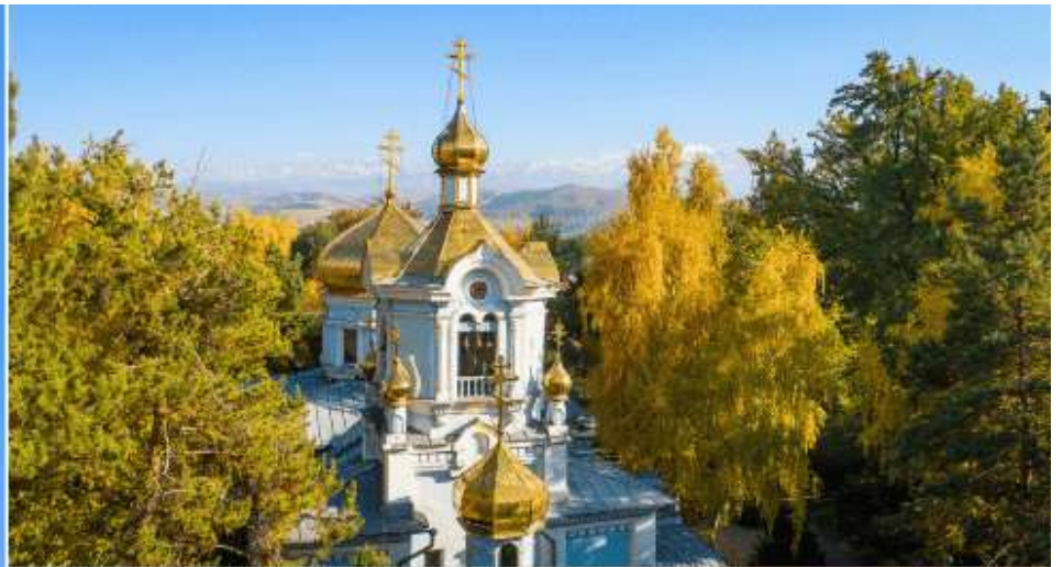
KAZAN ICON OF THE MOTHER OF GOD CATHEDRAL