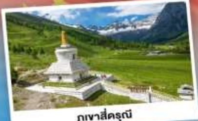
กุ๋เขาสีดรุณี