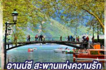
อานน์ซี สะพานแห่งความรัก