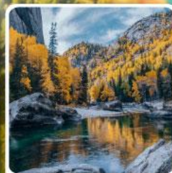
เคอเคอทัวไห่