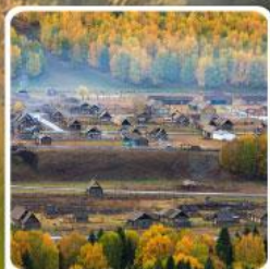
หมู่บ้านเหมอู่