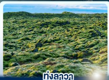
ทุ่งลาวา