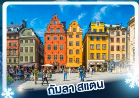
กับลาสแตน