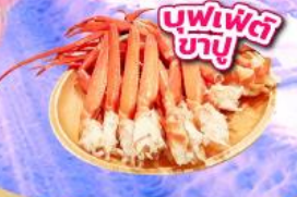
บุฟเฟ่ต์ ซาซู