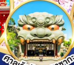
ศาลเจ้านับบะยะซากะ