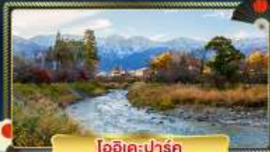
โออิเตะพาร์ค