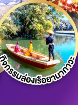
กิจกรรมล่องเรือยามากะ