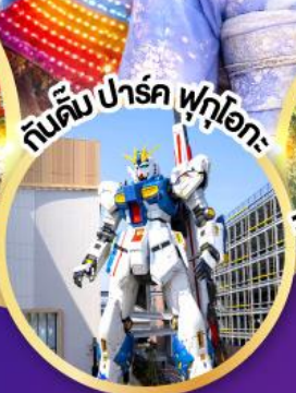
กันดั้ม ปาร์ค ฟุจิกะ