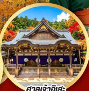
ศาลเจ้าฮิเอะ