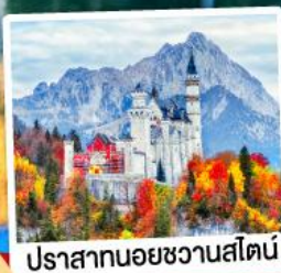
ปราสาทน้อยชวานสไตน์

เดินทาง 7วัน 4คืน 24-30 มิ.ย.69 02-08 ก.ย.69 16-22 ก.ย.69