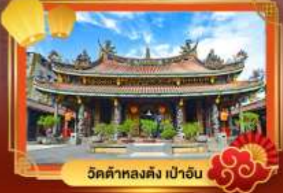
วัดต้าหลงตง เป่าอัน